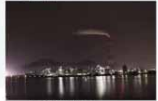
中山 復明/眠らない対岸 (若松区から見た八幡西区工場群)