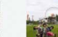
東台なかよしクラブ/みんなが笑顔 (八幡東区 スペースワールド)