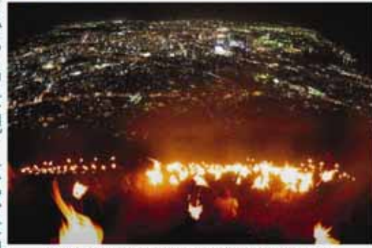
三浦 誠/夜空を照らす小文字焼 (小倉北区 小文字山からの小倉市街地)