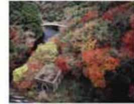
門本 直身/ダムとレンガの建物 (八幡東区 河内貯水池堤下)