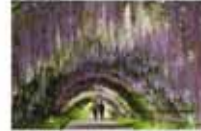
深野 安弘/思い出の橋のトンネル (八幡東区 河内橋)