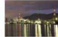
河野 光彦/暮色〜わが家のシンボル〜 (若松区から見た八幡西区工場群)