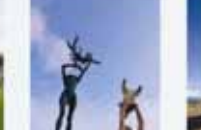
原藤 啓弘/羽ばたけ、我が子 (小倉北区 海岸橋)