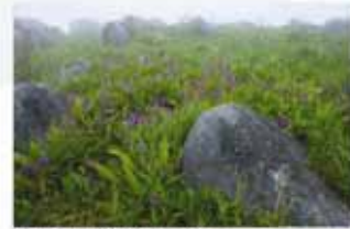
遠藤 晴世/霧に包まれて (小倉南区平尾台)