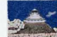
後藤 秀一/夏のおもひで (小倉城)