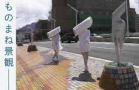
白坂 樹美/マカロニ星人 (小倉北区 太陽の橋)