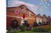
寺嶋 浩/おしゃべりファクトリー (ニッカウキスキー場門司工場)