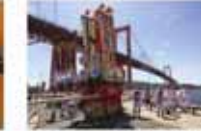
末廣 真三/戸畑地区お沙井浜み (戸畑区 若戸渡船場)