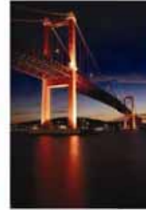
田代 博志/女優ライト (戸畑区から見た若戸大橋)