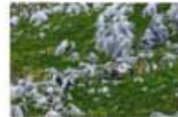
森田 道弘/カルスト台地の初夏 (小倉南区平尾台)