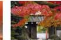
中尾 謙策/歴史と景観の入り口 (小倉北区寿山町 正寿山福徳寺)