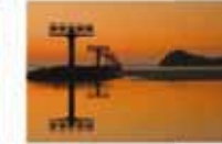
原戸 真規/日空海橋通り (小倉南区豊前 北九州空港)