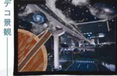
郡谷 博貴/銀河モノレール999 (JR小倉駅とモノレール)