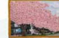
池田 智彦/さくら通り、桜満開! (八幡東区平野)