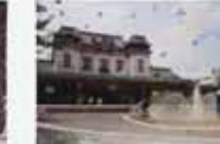
梅田 幸実・真津子/春せが舞り流る (門司港(旧門司埠頭))