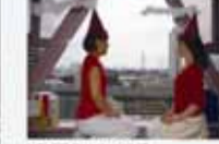
人丁/日食の中の工場 (小倉北区 新日鐵倉庫小倉製鉄所)