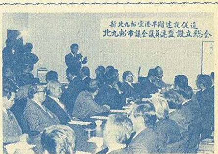
新北九州空港早期建設促進北九州市議会議員連盟設立総会

国体への気運を盛りあげるため、広報塔の設置や街頭啓発などを積極的に行うとともに、国