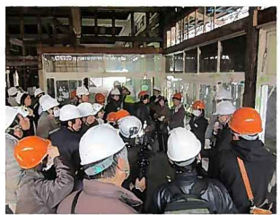
平成25年 『折尾駅舎見学会』