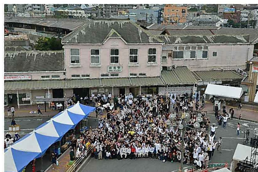
平成24年 『ありがとう折尾駅舎』イベント