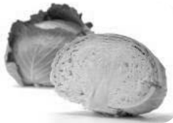
若松潮風キャベツ

「食」に関する産業の振興、「食」を活かしたまちづくりを図るための取組に努めていきます。