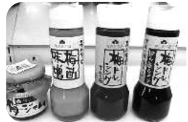
農産加工品 (ドレッシング・ジャム)