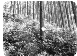
間伐後 (明るい森林：下草が豊かになります)