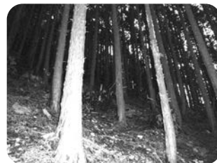
間伐前 (暗く下草がない森林)

市が福岡県森林環境税を活用して実施しますので、個人・会社の費用負担はありません。