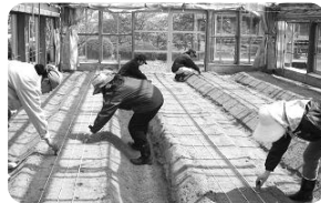
スイートコーン播種

平成17年から実施している「新農業者育成研修」が、今年度は総合農事センターのほ場で行われています。この研修は、農業に興味を持ち就農を希望する方を対象に実習や座学を1年間行い、一般的な野菜の栽培技術や農業に関する基礎知識を習得することを目的として「北九州農業協同組合」「八幡農林事務所北九州普及指導センター」「北九州市」が連携して実施しています。今年度は、5人の受講者が、ハウスでスイートコーン、露地できゅうり、ピーマン、トマト、なす、えだまめなどの栽培を行っており、各野菜の管理のポイント、誘引やホルモン処理など具体的な作業方法、自分が作業しやすいような農機具を作製するといった工夫などを学んでいます。秋からは、軟弱野菜や秋冬野菜の栽培に取り組み、就農に向けて栽培技術や経営感覚の習得を目指していきます。