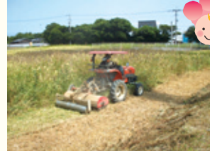
タネの育ち具合を見ながら土にすき込む作業に入る。

最近では北九州市のほうに、開花はいつですか? って、電話で確認してから見に来てくれる方が増えたんですよ。こうなってくると、やはりうれしくてね。「まとまった土地に沢山うえたら、圧巻だろうな」とか「どんなふう育てたら花がよく育つのかな」など、これからのひまわり畑を想像したり、育て方に気を配ったりするようになってきました。