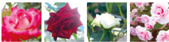
聖火 黒真珠 緑光 早春