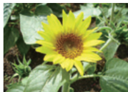
サンリッチレモン

どちらのタイプも播種時期は4月の下旬から5月が適期です。種は高温を好むタイプなので、あまり早く播種しないよう注意しましょう。