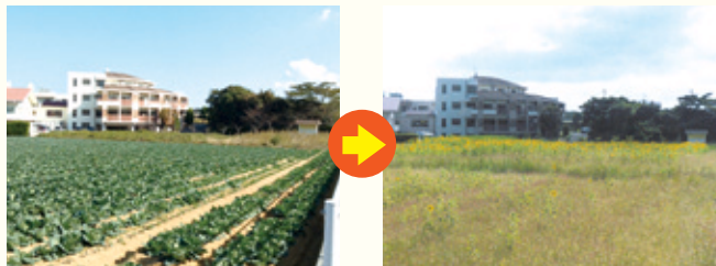
老人ホームの方にも楽しんでいただけるように、窓から見える場所に植えている。(安屋地区)写真は同じ場所の秋と夏。

今 今でこそ、この有毛・安屋地区のひまわりは有名になってきて、ドライブコースになったり、写真を撮ったり、写真をたくさん撮って行く方が増えて、ひまわりが咲く間だけはまるで観光地のようになりましたけど、実は、畑を賑わすためにひまわりを咲かす、ということが目的じゃないんです。こちら一帯の畑は「潮風キャベツ」の指定産地になってましてね、そのキャベツの「緑肥」として育てているのが目的なんです。つまり、花が咲くのは副産物ですね。