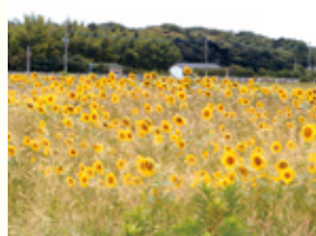
夏の畑に咲き誇るひまわり。(有毛地区)

めはまず是有毛地区からスタートし、その一年後くらいに安屋地区で始まりました。最初はね、肥料としてしかひまわりを見ていませんでしたが、年々楽しみが増えて来ましてね。しかも、始めるとなかなかやめられないところもありまして(笑)。