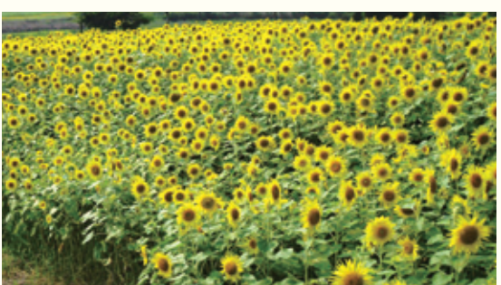
道路沿いに咲くひまわり。(安屋中谷地区) 今年には更に見所が増える事が大いに期待されます。