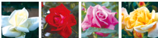
正雪 宴 紫雲 万葉