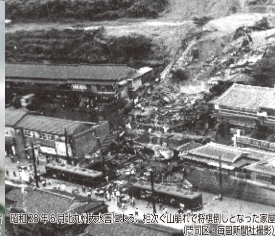
昭和 28 年 6 月北九州大水害による、相次ぐ山崩れで将棋倒しとなった家屋 (門司区)