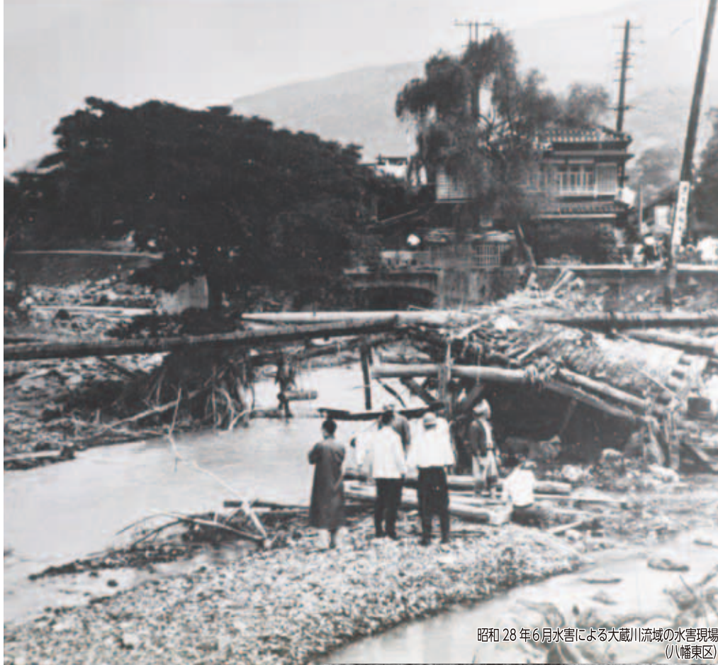
昭和 28 年 6 月水害による大蔵川流域の水害現場 (八幡東区)