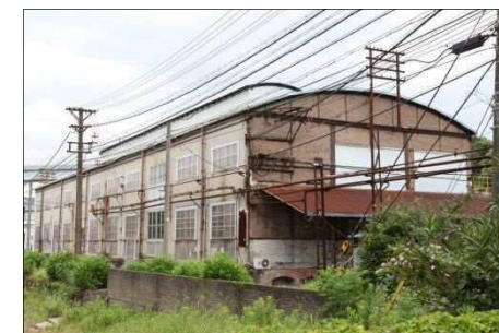
旧鍛冶工場 (非公開)