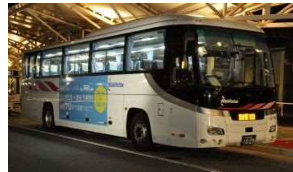
福北リムジンバス