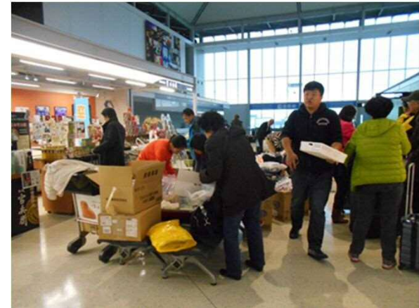
中国・大連チャーター