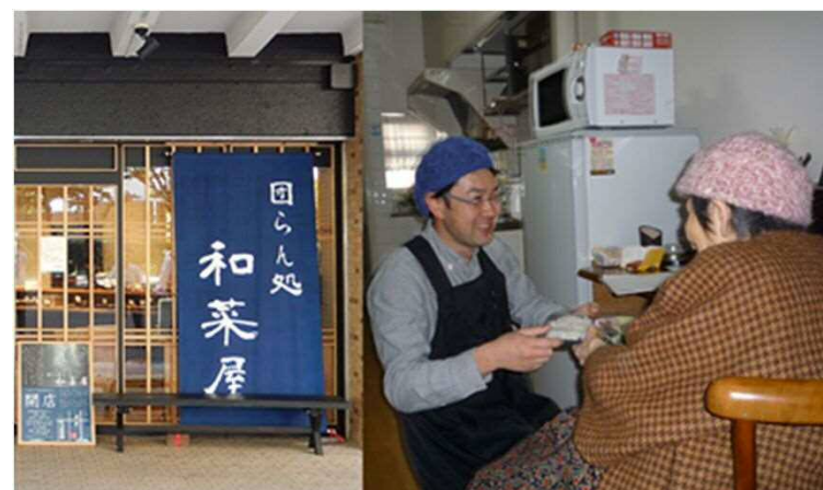
在宅高齢者に向けた惣菜等の宅配事業