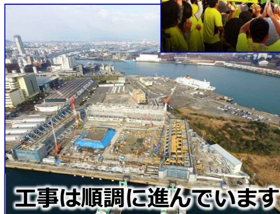
工事は順調に進んでいます