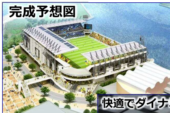
快適でダイナミックな観戦環境