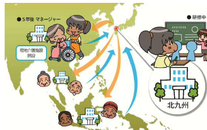
技能実習制度を活用した介護事業の国際展開