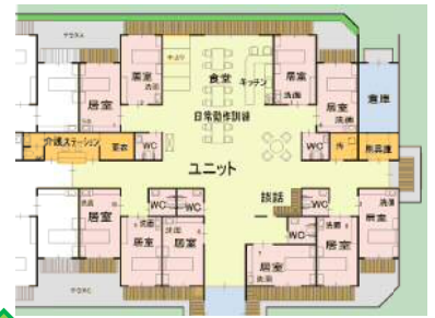
これまでの介護施設