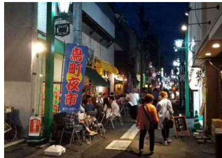
②魚町 11 号線