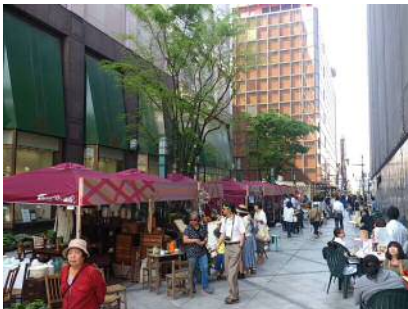
①船場町 1・6 号線