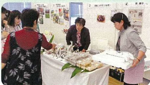
展示・販売コーナーの様子「女性農業者の大活躍大会2015」

※同時開催 北九州市農山漁村女性ネットワーク交流会等による 農水産物の展示販売会 (販売時間 11:00~13:00 16:00~17:00)