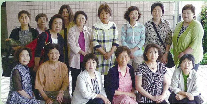
北九州市農産加工グループ協議会の皆さん