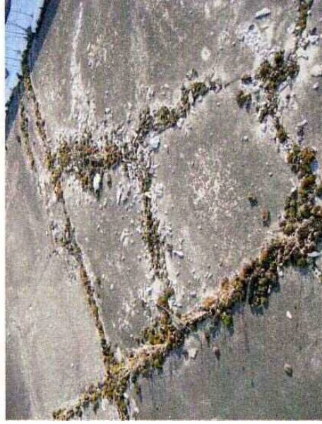
防水保護コンクリートの亀裂