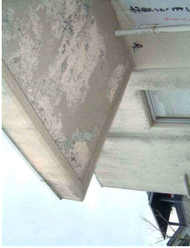
鉄筋のさびによる仕上げ材はく落