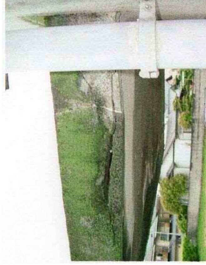
モルタルの亀裂＋こけの発生