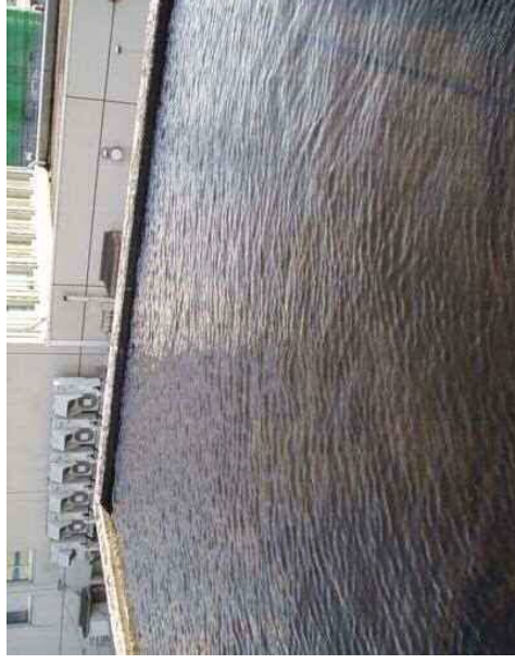
排水不良による水たまり