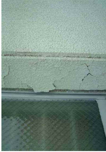
塗装仕上げ材の浮き・はく落