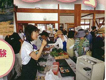
野菜ソムリエによる試食の様子