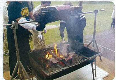
小倉牛もも丸焼き