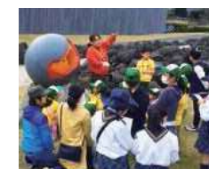
脚本家・倉本聰氏が塾長を務める富良野自然塾の環境教育プログラムを体験できる!