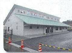
若松妙見かき小屋