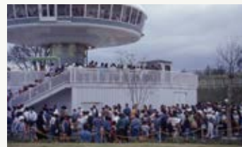
当時のフェアの様子