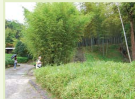
小倉南区 合馬竹林公園 ▶P60

自然の竹林を利用した園内には、国内外の竹やササ類約150種を集めた見本園(約1.2ha)があります。