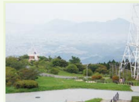
八幡東区 帆柱自然公園 ▶P33MAP

大芝生広場、サイクリングターミナル、サイクリングコース、大北亭、野鳥観察コーナーといった、自然を生かした施設が設置されています。