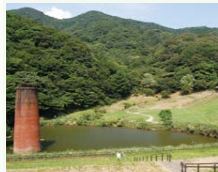
門司区 小森江子供のもり公園 ▶P41

山間部は、バードウォッチングや花見の名所。海沿いには、関門海峡を間近に望むノーフォーク広場や遊歩道もあります。