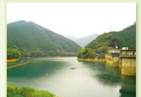
小倉南区 鱒淵公園 ▶P33MAP

自然の竹林を利用した園内には、国内外の竹やササ類約150種を集めた見本園(約1.2ha)があります。