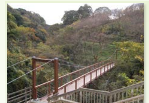
八幡東区 河内桜公園 ▶P33MAP

帆柱山(489m)、皿倉山(622m)、権現山(617m)などからなる帆柱連山一帯が帆柱自然公園。春秋の渡り鳥のシーズンには、1日に7万羽もの野鳥が集まります。四季の野草も豊富です。