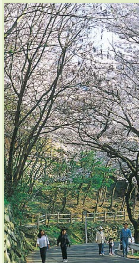
小倉北区 足立公園 ▶P49

森が延々と続く自然豊かな公園。都心に近いこともあって、多くの方がウォーキングや森林浴を楽しんでいます。