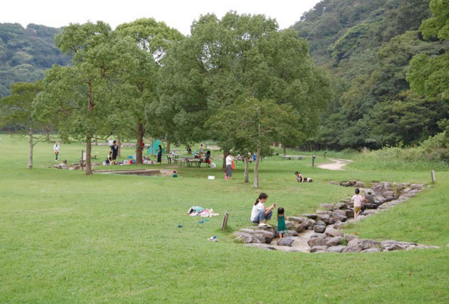
小倉北区 山田緑地 ▶P45

豊かな自然の森が手つかずのままにあるのが山田緑地。森の自然にふれ、体験しながら観察することができる利用区域、今ある植生を維持しながら、人が自然にふれあい、親しむ保全区域、基本的に人の立ち入りを禁止し、照葉樹林(常緑広葉樹林)への移り変わりを見守る保護区域の3つの区域にわけられています。