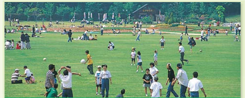
若松区 響灘緑地 ▶P61

三日月型をした鱒淵ダムに隣接した、自然景観を生かした公園。遊歩道やハイキングコース、サイクリングコースなどがあります。