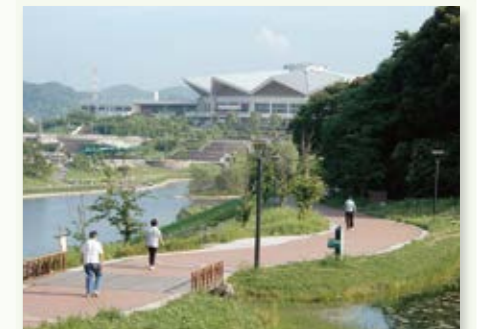
戸畑区 中央公園 ▶P74

河内貯水池(新日鐵住金八幡製鉄所の工業用池)の堰堤下にある公園。豊かな緑の中に散歩道がめぐっています。