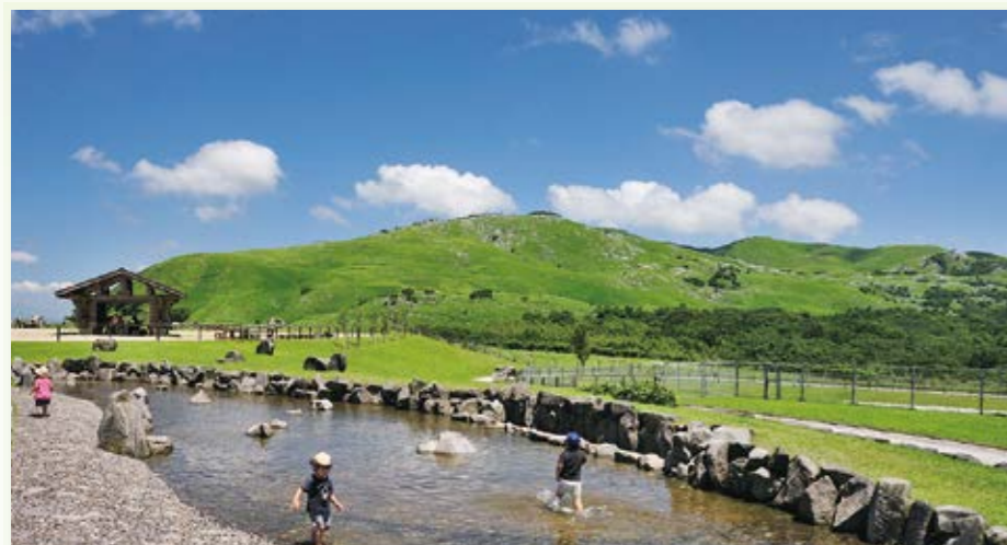
小倉南区 平尾台自然の郷 ▶P53

北九州市の公園には豊富な自然を生かしたところもたくさんあります。そんな公園で、自然に親しみ、遊び探検してはいかがでしょうか。