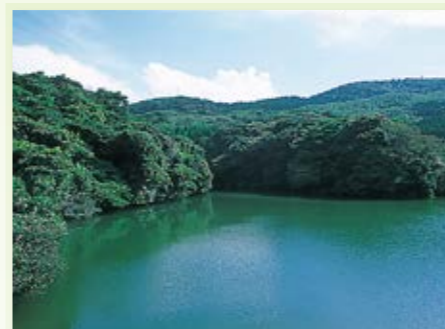
若松区 菖蒲谷池自然公園 ▶P33MAP

森が延々と続く自然豊かな公園。都心に近いこともあって、多くの方がウォーキングや森林浴を楽しんでいます。