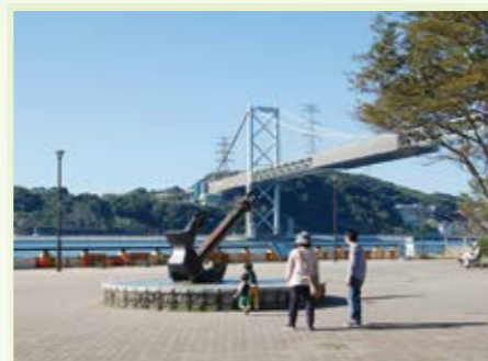
門司区 和布刈公園 ▶P39

園内には、芝生広場・展望台・果樹園・キャンプ場・草り場のほか、そば打ち・陶芸・アートフラワー・木工などの体験教室やレストラン、お土産ショップなどがあります。日本有数のカルスト台地を満喫でき、ゆったりと過ごせます。