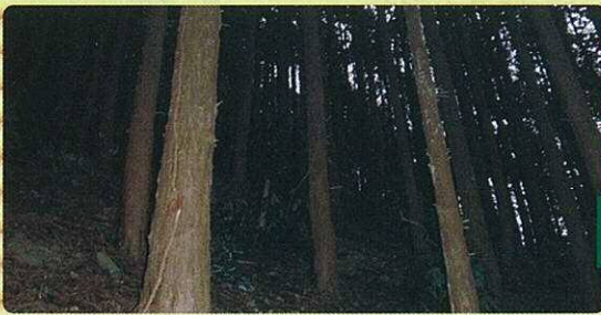
間伐前（暗く下草がない森林）