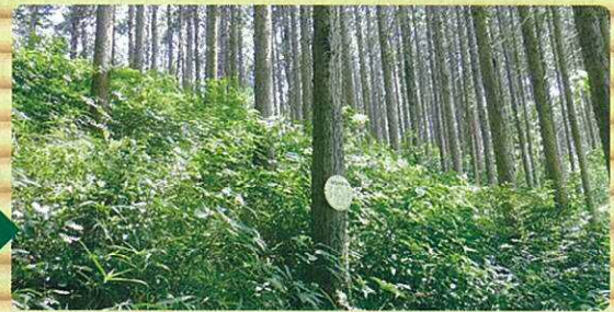
間伐後（明るい森林：下草が豊かになります） ※木材の価値や防災効果等が高まります