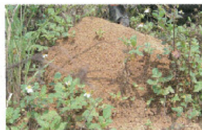
土で作られるドーム上のヒアリの巣