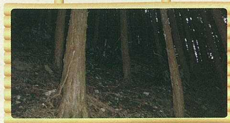
間伐前(暗く下草がない森林)

■ 費用：市が福岡県森林環境税を活用して実施しますので、個人・会社の費用負担はありません。