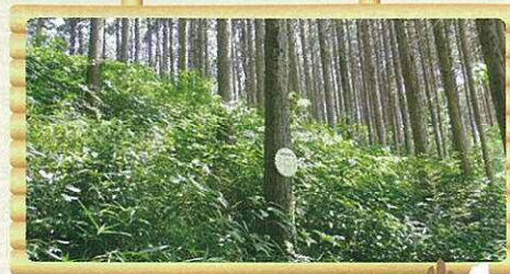
間伐後(明るく下草が豊かになります。)