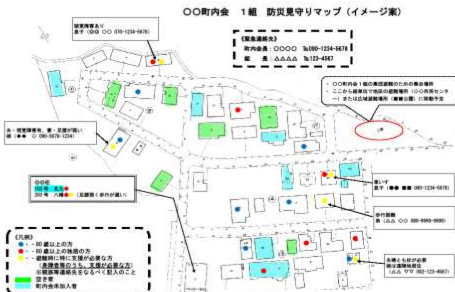
防災みまもりマップ (イメージ図)

今後も、地域のつながりが災害時の犠牲者を減らし、毎日の生活の安心・安全を作り上げるものとして、『防災みまもりマップ』を通じた地域の“見える化”に取り組めます。