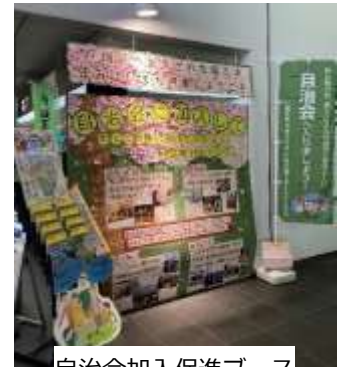
自治会加入促進ブース

転入者が多く来訪する3月中旬から、戸畑区役所1階に、ブースを設置し、自治会の重要性や取組みを紹介しました。