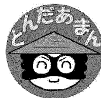
第1緑地保育センター オリジナルキャラクター “とんだあまん”