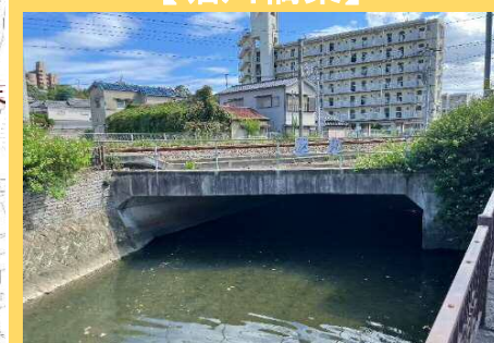
残存鉄道施設の撤去 【堀川橋梁】