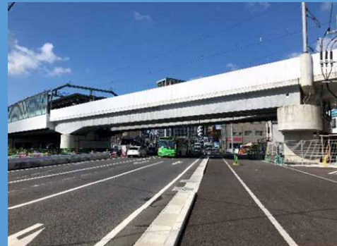
【筑豊本線 国道踏切】