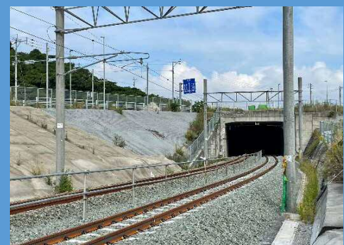
【筑豊本線トンネル】