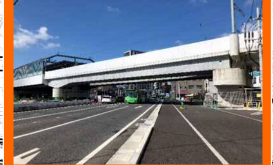
折尾駅北口へのアクセス道路 【日吉台光明線】