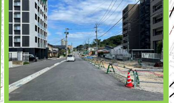
折尾駅南口へのアクセス道路 【折尾東西線】