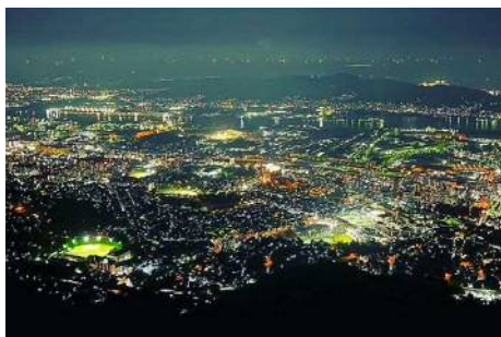
皿倉山からの夜景

このような北九州市の歴史や文化、産業など、暮らす人が育んだ魅力が、訪れた人との交流するきっかけ作り、にぎわいや活気、新しい文化を生み出す原動力となり、都市の発展につながっていきます。