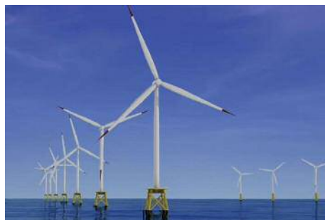
響灘の洋上ウインドファームイメージ図 (グリーンエネルギーポート事業紹介動画より)