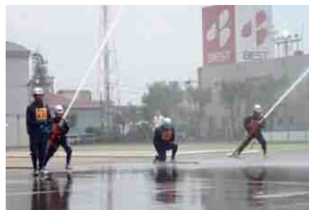
消防ポンプ操法大会

若松区には、若松消防団及び洞海湾消防団の2つの消防団が設置されており、消防団は自分達の町は自分達で守るという郷土愛の精神に基づいて、市民で組織された防災の機関です。地域における消防防災のリーダーとして、平常時・非常時を問わずその地域に密着し、住民の安心と安全を守るという重要な役割を担っています。災害や消火活動はもとより、イベントの警備や高齢者の住宅訪問、予防広報活動等も行っています。