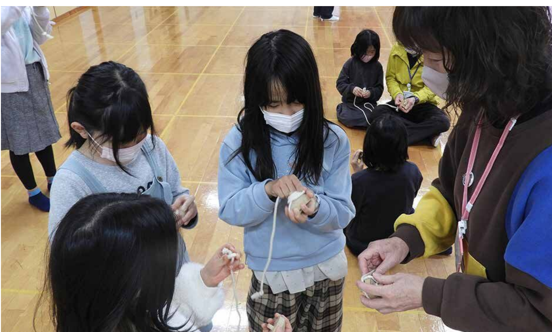
子育て支援活動(未就園児と保護者との交流)