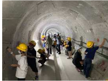
小学校現場見学会の様子