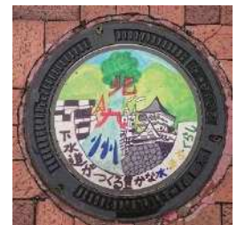
デザインマンホールの例