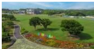
響灘グリーンパーク