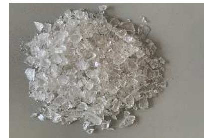
PV光学式選別後破碎カレット