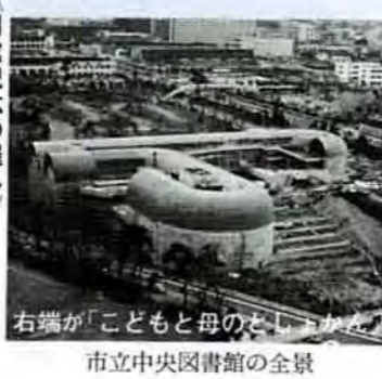
市立中央図書館の全景

なお、歯科診療は、歯科医師会の協力で12月29日から1月3日まで（午前9時～午後5時）毎日交代で市内五か所の歯科医院が開院します。必要な時は、休日急患診療センターかサブセンターへ照会してください。 受診する方へお願い 休日の診療に従事する医師、看護師、医療技術者のみなさんは自分の休日を返上して、この業務にとりくみます。急病で診療を必要とする人に、正しく利用されるようにご協力をお願いします。 ①かかりつけの医師がある人は、まずそこで診療を受ける ②そこが休診のときは、もよりの休日急患診療所（サブセンター）に行くか相談する ③夕方5時から翌朝9時までは診療センターに行くか相談する ④緊急やむを得ない時以外は救急車（119番）を使わない ⑤保険証を忘れずにお持ちください。初診料、自己負担金は小銭を用意してください。