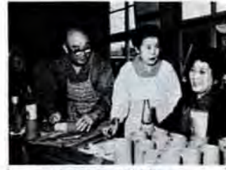
老人大学陶芸教室... 足立公民館で