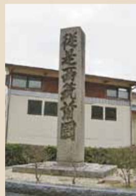
高見二丁目にある国境石