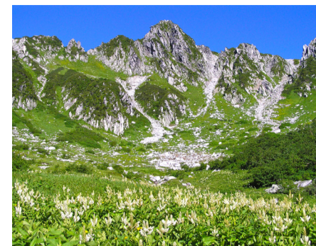
▲高山植物の宝庫として知られる千畳敷カール

名古屋小牧空港(愛知県)から駒ヶ岳千畳敷カールや赤沢森林トロッコ列車(いずれも長野県)などを巡るツアー。出発は6月29日(水)、7月13日(水)・25日(月)、8月29日(月)。泊2日・3食付き。料3万5000円・4万3000円。①読売旅行北九州営業所 ☎521・5511へ。②港湾空港局空港企画課 ☎582・2308。