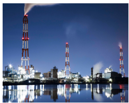
▲近未来のように幻想的な工場夜景

洞海湾(アール・シップ)血倉山からの夜景観賞、クロワッサンの試食など。出発は6月4日(土)・11日(土)、7月2日(土)・23日(土)、8月20日(土)・27日(土)、9月10日(土)・24日(土)。集合・解散は小倉駅。小学生以下は保護者同伴(各45人)。料5400円。詳細はJTB九州(受付専用) ☎092・751・2102へ。⑦産業経済局観光課 ☎551・0100。