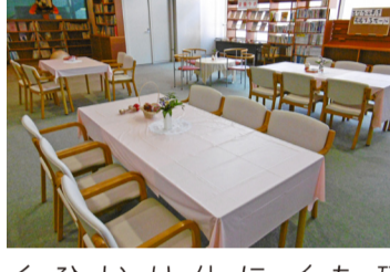
カフェ・オレンジ以外にも、福岡県栄養士会、福岡県歯科衛生士会の協力で実施する、栄養ラボや認知症・介護予防に関する最新情報コーナー、認知症について相談できるコールセンターを設置しています。また、健康づくり推進員や口コ予防推進員等

本市では、市民が住み慣れた地域で生き生きと暮らせる社会の実現を目指し、さまざまな取り組みを進めています。その中でも、社会的な課題となっている「認知症支援」と「介護予防」への取り組みとして、新たに総合保健福祉センター5階（小倉北区馬場二丁目）に「認知症支援・介護予防センター」を開設しました。同センターは、認知症の人やその家族の日常生活を支援し、自主的に継続的な介護予防活動を総合的に支援する「主市レベルの拠点」となります。 また本市は、「NPO法人老いを支える北九州家族の会」、認知症・草の根ネットワーク（北九州医師会）、北九州市歯科医師会、北九州市薬剤師会と運営に関する連携協定を結びました。 この連携協定を生かし、認知症の人やその家族、地域で活動する皆さんを中心に、専門職団体や行政などの関係者が力を合わせて、認知症や介護予防の課題に取り組みしていきます。 認知症カフェ 認知症の人とその家族として自分らしく、社会と関わりを持ちながら情報交換などができ、心が安らぐ場所となるように運営されるカフェです。カフェという日常的な場での交流を通じて、認知症への偏見をなくし、認知症になっても暮らしやすい地域をつくる