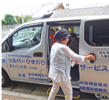
■福祉有償運送実施団体へ。

市内福祉有償運送実施団体 ●陽気（小倉南区石田南一丁目 ☎963-3838） ●好楽会（小倉南区南方五丁目 ☎5822-2060） ●陽気（小倉南区石田南一丁目 ☎963-3838） ●好楽会（小倉南区南方五丁目 ☎5822-2060） ●陽気（小倉南区石田南一丁目 ☎963-3838） ●好楽会（小倉南区南方五丁目 ☎5822-2060）