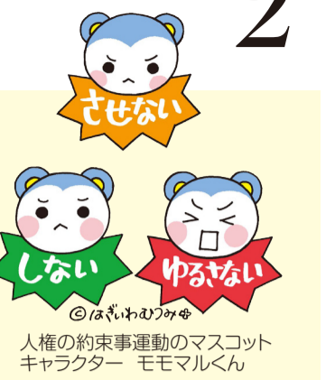
人権の約束事運動の Mascot キャラクター モモマルくん

「人権問題・差別問題に対する市民の関心は高まっている」。昨年9月に北九州市が行った「人権問題に関する意識調査」(20~79歳の市民5000人対象)では、74.4%の人が、人権問題・差別問題に関心があると答えており、5年前に行った調査より6.2%増加しています。7月は「福岡県同和問題啓発強調月間」です。同和問題は基本的人権に関わる重要な問題です。市民一人一人が人権を尊重し、この問題について正しい知識を身に付け、理解を深めることが重要です。