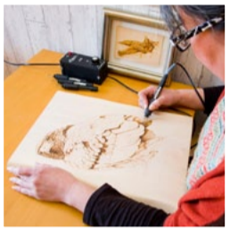
▲細い線を繰り返し電熱 ペンで描く繊細な作業

作品は動物 本来の姿や 動きに限り なく忠実 だ。作品制 作にあたっては、まず、書物やイ ンターネットでその動物に関す るさまざまな情報を収集し、動 物園にも赴き写真を撮影する。 「模様や毛の流れだけではなく、 動きや生活環境に至るまで 嘘は描きたくない」と思っていま す。おかげでいつも資料が膨大 で、準備が大変です。そして、描 き始めるのは最もだわるとい う目から。「目に光を入れた時 に、絵が命を持つような気がし ます。この一筆目で成功するか どうかが決まると言っても過言 ではありません」とペンに思い を込める。