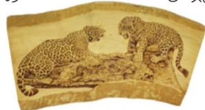
▲日本ウッドバーニング協会主催の コンテストで最高賞を受賞した作品

現在、日本ワイルドドライファ ート協会に所属する彼女が描 くのは主に動物で、しかもオオ カミヤトフなど野生の大型ネコ 科が多い。その理由を彼女は 人類の生活の影響で絶滅のふ ちに立たされています。作品を 通して少し立ち止まって、彼ら の現状に気 付けて欲し いという 思いがあ ります」と 話す。 それだけ に、彼女の