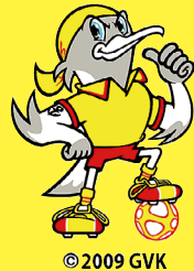
▲ギラヴァンツ北九州クラブマスコットギラン

サッカー J3公式戦「対 ガンバ大阪U-23」に優待価格で入場できます。6月10日(土)18時から、ミクニワールドスタジアム北九州(小倉駅北側)で。優待席種はホームC自由席。■試合当日に門司区民(在住・在勤・在学も含む)であることを証明できるもの(免許証・保険証・社員証・学生証など)を「区民感謝デーチケット受け付け窓口」で提示後、優待価格(入場料一般500円、小学～高校生100円)でチケットを購入できます。問市民文化スポーツ局スポーツ振興課☎582・2395へ。