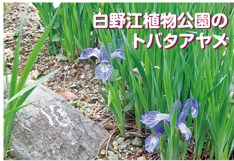
白野江植物公園のトバアヤメ

サッカー J3公式戦「対 ガンバ大阪U-23」に優待価格で入場できます。6月10日(土)18時から、ミクニワールドスタジアム北九州(小倉駅北側)で。優待席種はホームC自由席。■試合当日に門司区民(在住・在勤・在学も含む)であることを証明できるもの(免許証・保険証・社員証・学生証など)を「区民感謝デーチケット受け付け窓口」で提示後、優待価格(入場料一般500円、小学～高校生100円)でチケットを購入できます。問市民文化スポーツ局スポーツ振興課☎582・2395へ。