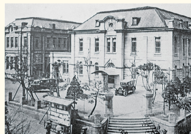
▲八幡市役所(大正10年頃)

その後、町制施行により「八幡町」となった翌年、明治34年(1901年)に高炉の火入れが行われ、我が国初となる銑鋼一貫の「官営八幡製鐵所」が創業を開始。「鉄の街・八幡」の歴史が始まりました。