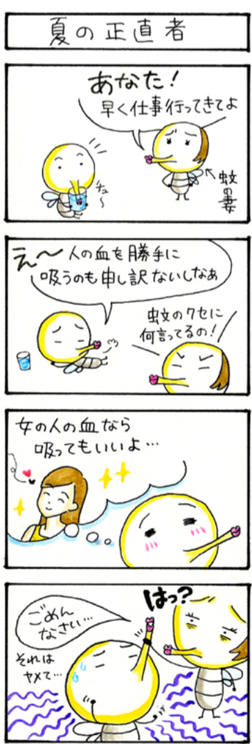
▲ぼんぼんさん(ペンネーム)が描いた4コマ漫画(銀賞受賞)