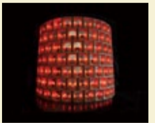
▲FXハルソノ《遺骨の墓地のモニュメント》2011年、作家蔵

1980年代から現在までの東南アジアの作品約90点。11月3日(祝)～12月25日(月)の10～20時(入場は19時30分まで。水曜日は休館)、福岡アジア美術館で。観前売り一般600円、高校・大学生300円。当日200円増し。前売り券はローソンチケットなどで発売中。☎同館(福岡市博多区下川端町、☎(092)263・1100)へ。