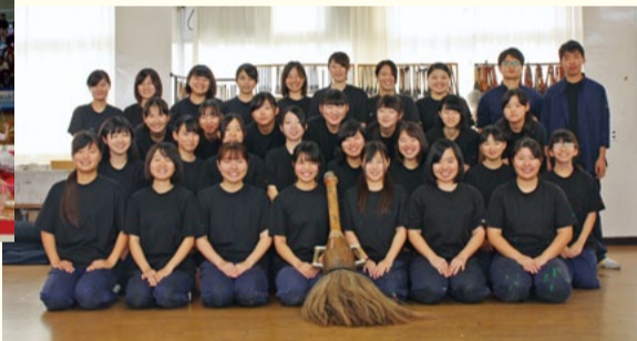
▲八幡中央高等学校書道部の皆さん

福岡県立八幡中央高等学校芸術コース書道部（書道パフォーマンス）ス（八幡西区） 書道パフォーマンス甲子園（全国高等学校書道パフォーマンス選手権大会）優勝。