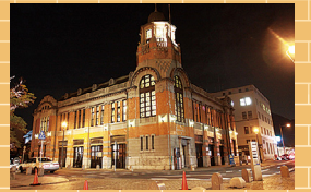
シリーズ日本遺産 「旧大阪商船」