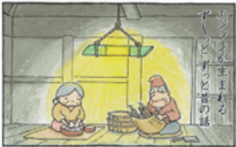
「漫画ミュージアム賞」 「竹取物語」 (浅沼ひろゆき/東京都)

審査員評 美しい色彩と穏やかな描線に和ませられる一方で、「かぐや姫」の行く末が非常に心配。きれいなだけではない、センスあふれる傑作。