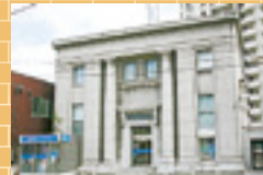
シリーズ日本遺産「中国労働金庫下関支店(山口県下関市)」