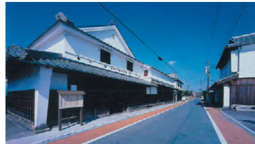
八幡西区木屋瀬地区

北九州市は、門司港レトロ地区や木屋瀬の宿場町など、歴史を感じられる街並みや、西日本工業倶楽部（旧松本家住宅）や旧古河鋳業若松ビルなど、歴史的建造物が数多く残っています。これらは、私たちのふるさと意識を育み、まちの風格を高めるための大きな役割を果たし、魅力あるまちづくりの基盤となります。そこで、文化財の保存や観光拠点の整備との取組と連携し、歴史的な街並みや建造物の保全を進めています。八幡西区木屋瀬地区においては、平成10年から、一定要件を満たした建造物等に対して、修理・修景の一部を助成しています。