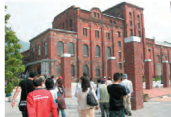
門司赤煉瓦ブレイス：門司駅北側地区

景観は、人と自然の営みから形づくられたものであり、北九州の歴史や文化、経済活動など、まちの姿そのものを表しています。したがって、景観づくりは、まちづくりの根幹となる大切な取組であり、市民・事業者・行政が協働して取り組んでいくことが必要です。本市では、「北九州市景観づくりマスタープラン」を策定し、市民のみなさんが北九州の景観を知り、地域主体の景観形成の取組が進むよう積極的に支援するとともに、景観意識の向上や担い手育成に取り組み、市民の主体的な景観づくりを推進しています。