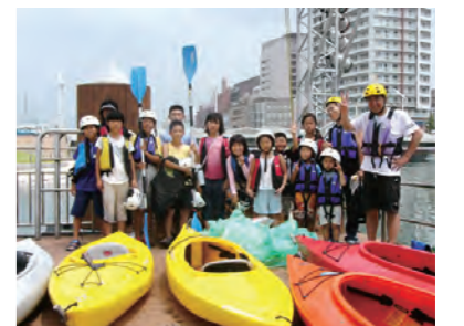
▲紫川を満喫した「カヌーでゴミ拾い」

市民が市域に生息する希少な野生生物や豊かな自然環境とふれあう機会をつくるため、エコツアー(自然環境講座)を平成14年度から開催しています。平成20年度は「カブトガニの産卵観察」など市民団体の協力を得て行った環境局主催事業や、「カヌー教室」などNPO主催事業を開催しました。