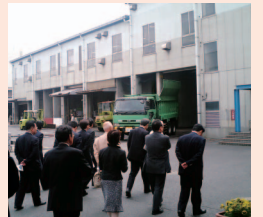
平成20年5月30日 日明リサイクル工房