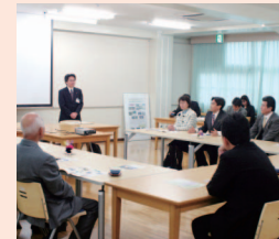
平成19年12月19日 北九州中央高等学園