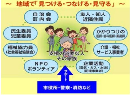
いのちをつなぐネットワーク事業