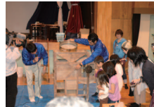
菜の花プロジェクト2011 in 河内温泉

本市では、補助金の交付や種子の配布、搾油機の貸出しなどの支援を行い、資源循環型の社会を築く取組として、菜の花で学ぶ環境教育を推進していきます。