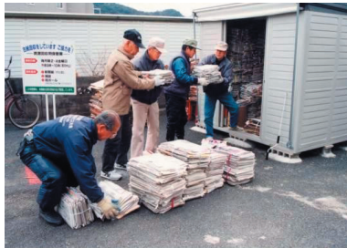
保管庫を利用した古紙回収