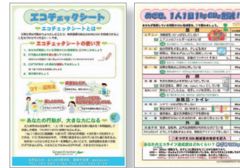
エコチェックシート

市民一人ひとりによる温室効果ガス削減に向けた取組として、家庭からの二酸化炭素排出量の削減を目的としたエコライフの普及啓発を行っています。具体的には環境に興味を持ち、エコライフを推進するきっかけづくりとして、環境家計簿の簡易版にあたる「エコチェックシート」やカレンダーに環境家計簿とエコライフを紹介した「エコライフカレンダー」を配布し、より幅広い年齢層へエコライフ実践の呼びかけを行っています。