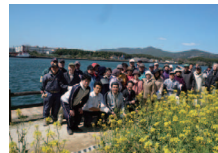
北九州市を明るく元気にする会(八幡東区枝光)