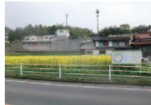
北九州グリーンヘルパーの会(小倉南区徳吉南)