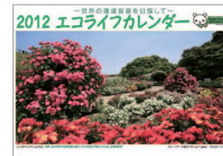
エコライフカレンダー(2012年版)