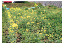
八枝まちづくり協議会(八幡西区北筑)