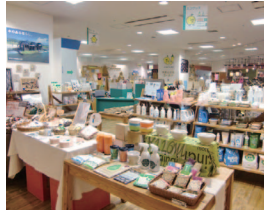
エコ商品の展示・販売の様子

プラザをAIMビル2階に開設しました。NPO法人に企画・運営を委託し、エコ商品の展示、販売、リユース品の販売、エコライフに関する情報の提供、毎日の生活に役立つ環境講座などを実施しています。(運営についての詳細は63ページ)