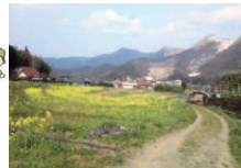
市丸菜の花育てよう会(小倉南区市丸)