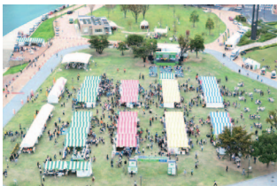
シンボル事業「エコライフステージ2011」