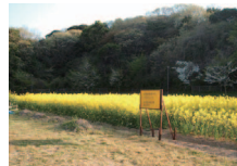
永犬丸の森公園 菜の花会(八幡西区永犬丸)