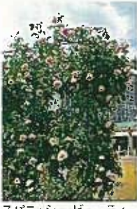
スパニッシュ・ビューティー

花系は3cmくらいで、背丈も20cm程度の可愛いバラです。小さな庭やコンテナ、鉢植えでの栽培に適していることから人気を呼んでいます。