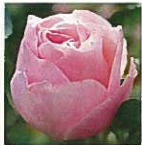
クィーン・エリザベス