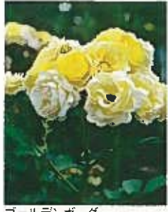
ゴールデンボーダー