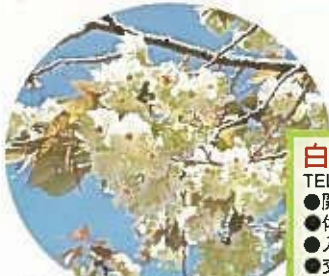
ギョイコウ(開花時期:4月下旬ごろ)