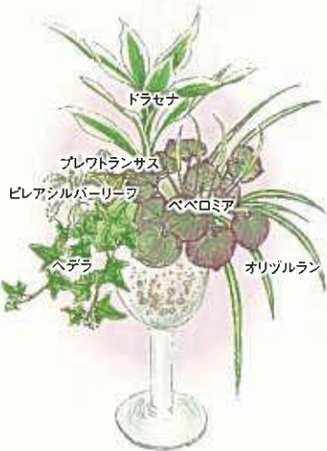
◆絵と文 西日本短期大学非常勤講師 グリーンアドバイザー