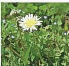
シロバナタンポポ

また、園内ではいろいろな種類の野の花を見ることが出来ます。例えば「アオイスミレ」をはじめとした野生のスミレ、日本の在来品種の「シロバナタンポポ」、花の形がかさをつけた顔の子を連想させることから名前のついた「オドリコソウ」などなど。春の野草は、小さな花を咲かせるのが特徴。森のなかを注意深く観察すると、紫色の「アケビ」の花にも出会えるかもしれません。