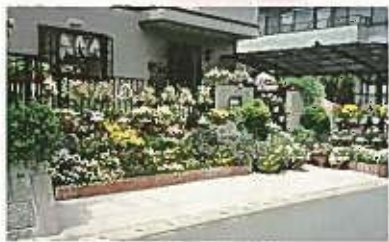
第3回北九州市花咲くまちづくりコンクール 個人部門優秀賞

●応募方法／区役所等で配布している専用の応募用紙に花の写真(サービスクレジット)を貼って送ってください。白薦、他薦は問いません。ガーデニングブームをきっかけに、ご家庭や職場などで花づくりを始めたい皆さんも、どしどし応募ください!!お待ちしています!!