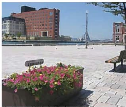
まちを美しく彩るパートナー花壇(門司港レトロ地区)