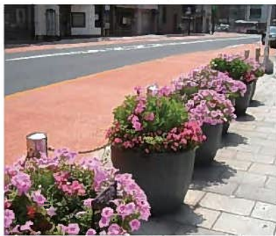
花壇サポーターにより、きお種やかに手入れをされているプランター(小倉北区)