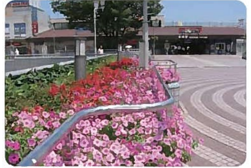
スポンサー花壇(黒崎駅前)