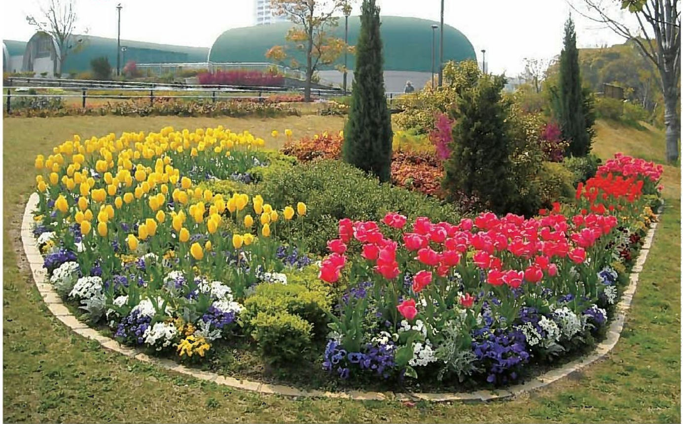
訪れる人々を翌季の花でお迎えするスポンサー花壇(勝山公園)