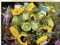
葉ボタンとひまわりが一緒の花束!!

公共の花壇では、夏にはベチュニア、マリーゴールド、ゼラニウムなど、日本と同じ春～秋の花が使われ、秋には、冬に向けての花に入れ替わっています。パンジーが主流で、コンテナではシクラメンをよく見かけます。公共では、維持管理しやすい花が基本のようです。ところが、園芸店やお花屋さんを覗くと、なぜか日本とは季節の違う花が置いてあるのです。8月の園芸店には、夏の日差しの中、す