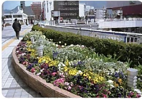
スポンサー花壇(小倉駅ペDESTリ/アンデッキ)