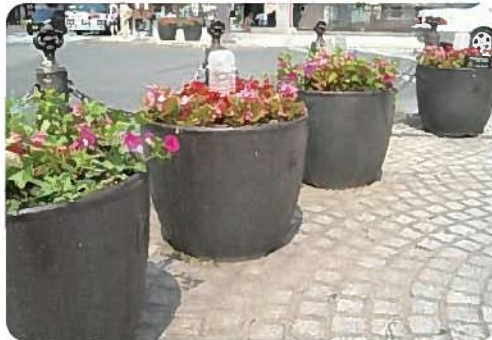
花壇サポーターの皆様にご協力いただいている花壇(小倉北区)