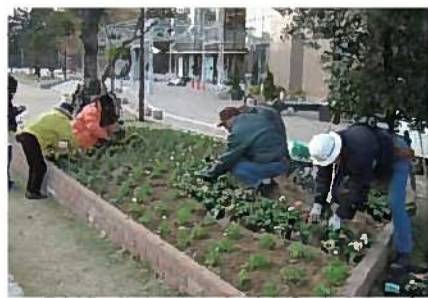
リバーワーク花壇づくり

北九州市の養成講座を修了し、市長の認定を受けたフラワーコーディネーターが地域の花つくりのコツを伝授します。花壇のデザインや、場所に合った花の選び方、種からの花つくりなど丁寧に指導してまいります。