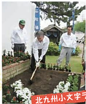
北九州小文字ライオンズクラブ

花や子どもたちの笑顔は、私たちを元気にしてくれます。これからも、「到津の森公園」の花壇は子どもから大人までみんなの笑顔を育み、見守ってくれることでしょう。心を元気にしたい時、お花を眺めにふらりと足を運ぶのもおすすめです。