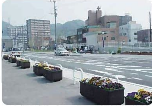
パートナー花壇(門司区)