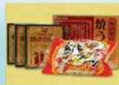
キタキュー-B級グルメセット